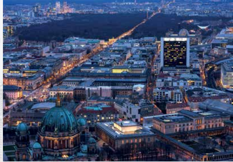
Atemberaubender Ausblick auch bei Dunkelheit.