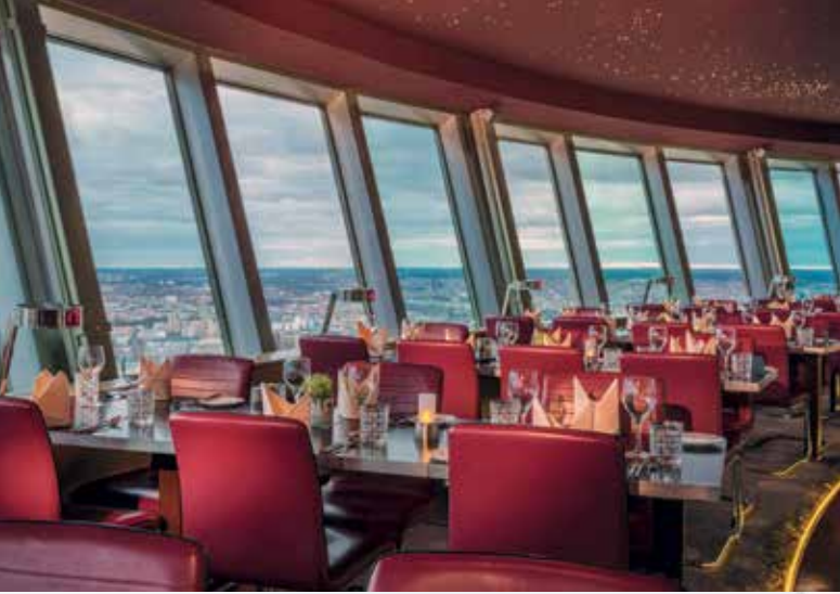
Das Restaurant auf dem Fernsehturm dreht sich um die eigene Achse.