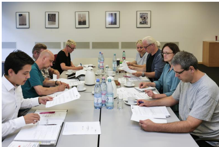
dbb Tarifkommission Charité

Wir wissen was wir wollen! Wir wollen die Überleitung der Charité in den KAV Berlin schnellstmöglich geregelt haben! Wir wollen keine Ungewissheit über die künftigen Arbeitsbedingungen für die Beschäftigten! Die nächsten Termine finden daher schon am 10. und 18. August 2017 statt. Wir werden weiter für den Erhalt aller Besonderheiten des TV-Charité kämpfen und hierüber berichten. Denn eines ist für die gkl und den dbb klar: Kein KAV-Beitritt zu Lasten der Beschäftigten!